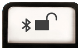
Modo Bluetooth® ADA