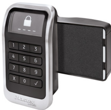
Cerradura electrónica integrada 3685

La cerradura electrónica para taquillas de Master Lock ofrece un nuevo nivel de innovación con su pantalla de alta visibilidad para un funcionamiento intuitivo, una batería de larga duración para reducir los costes operativos y funciones contra atascos para una seguridad fiable.