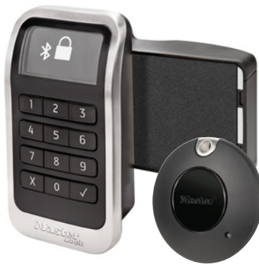
Cerradura electrónica integrada 3681 para taquillas con Llavero Bluetooth para Aplicaciones ADA