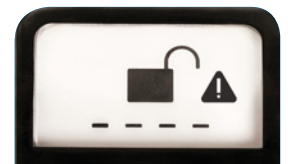
Alerta de atasco