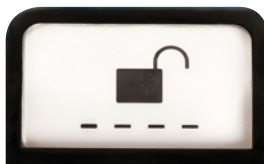
Modo para varios usuarios