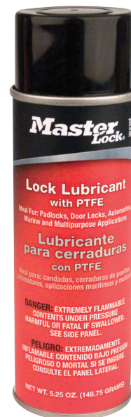
Aerosol de 155 ml 2305