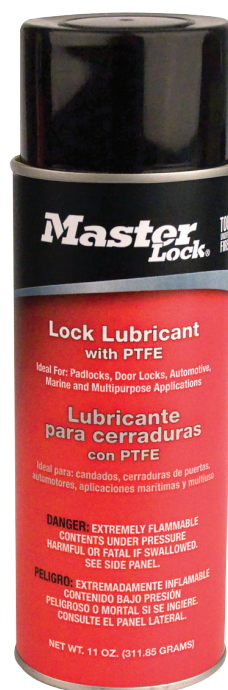
Aerosol de 325 ml 2311

El Lubricante para cerraduras Master Lock está disponible en varios tamaños : Use los aerosoles de 155 ml y 325 ml para el mantenimiento de las cerraduras y el dispensador de aceite de bolsillo, de 7 ml, cuando tenga que desplazarse.