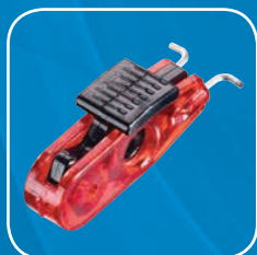
S2390 - Tiges métalliques vers l'extérieur : écartement de 11mm ou moins