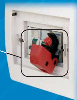
S2394 – Universel, fixation sans outil