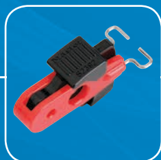
S2392 - Tiges métalliques vers l'intérieur : écartement intérieur 12.7mm