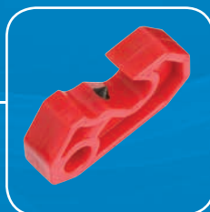
S2393 – Universel, fixation à l'aide d'un tournevis