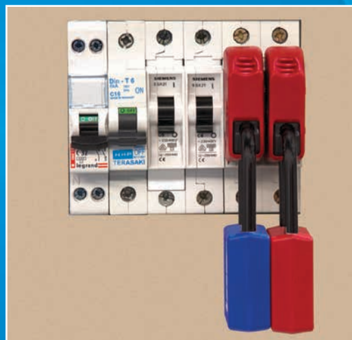
Disjoncteurs miniatures côte-à-côte consignés à l'aide du S2394 et du cadenas de consignation 410