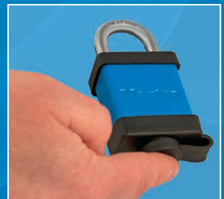
Une fois le cache serrure enclenché, le cylindre est protégé des impuretés