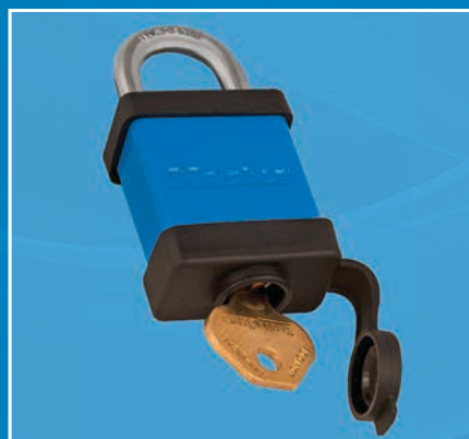
Facilite l'insertion des clés