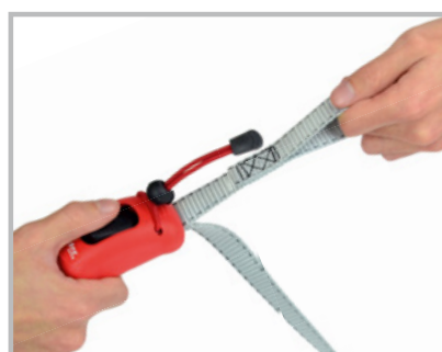
Botón de anclaje para ajustar la longitud de la correa