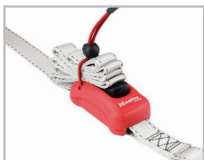
Strap Trap™ pratique