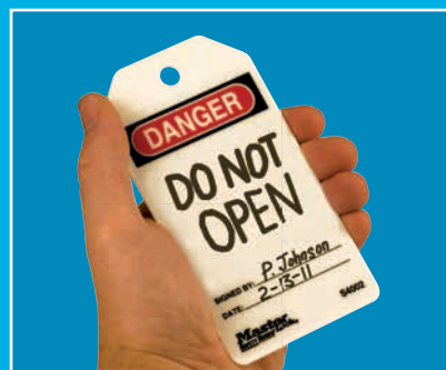
Nouveau message prêt pour le projet suivant