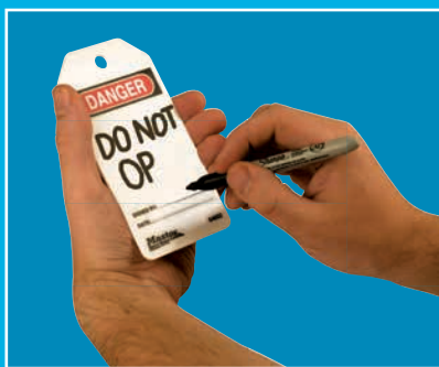
Étiquette nettoyée prête pour le message suivant – écrivez un autre message à l'aide d'un marqueur permanent