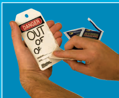
Effacez le message inscrit à l'aide d'alcool isopropylique

Inscrivez le message correspondant à la tâche avec un marqueur, effacez-le une fois le travail terminé et réutilisez le panneau/l'étiquette pour la tâche suivante.